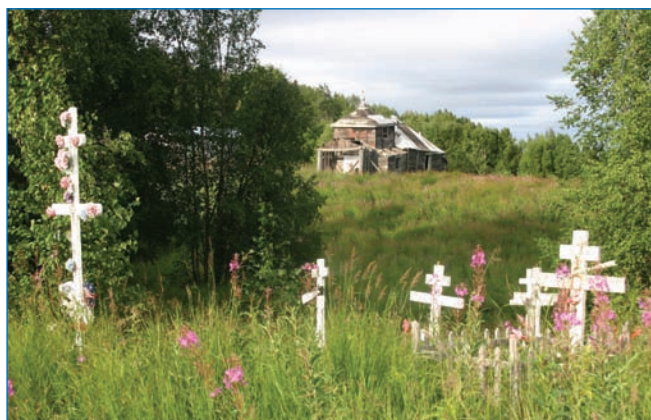
Старая православная церковь и одно из многочисленных кладбищ русских колонистов – наследие Русской Америки

В 2010 г. был проведен уникальный исторический эксперимент по изучению маршрутов движения русских путешественников и возможностей транспортно-торговых коммуникаций рек и озер Аляски. Северный отряд экспедиции «Аляска-2010» совершил водно-сухопутный переход из реки Юкон в реку Кукоквим. Переход был осуществлен по тому