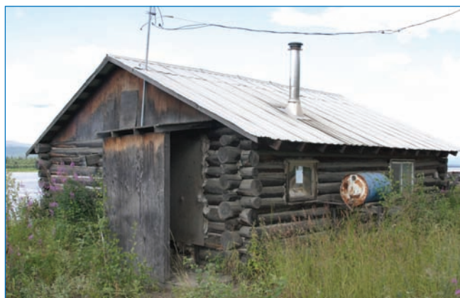
Русское влияние чувствуется на Аляске во всем, в том числе, в архитектуре домов