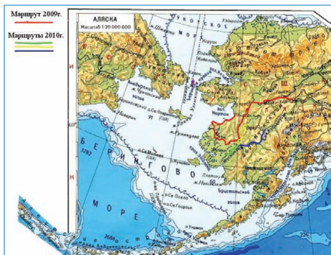
Карта маршрута экспедиций

Во время экспедиций было проведено этнографическое обследование с использованием специально разработанной методики, включавшей в себя опросы, сбор официальных данных, фиксацию наблюдаемых реалий жизни коренного населения. При этом структура собранных материалов позволяет провести их сравнительный анализ с этнографической информацией в книге Л.А.Загоскина.