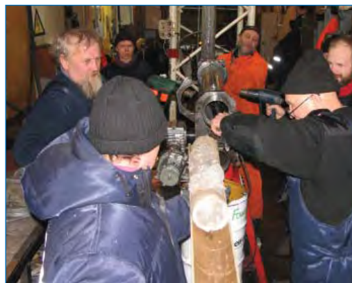
Последний керн скважины 5Г-2.

вения в озеро, в то время, когда буровой снаряд быстро тянули вверх, уходя от догоняющей его воды, в устье скважины появилась заливающая жидкость, которая стала медленно вытекать на пол буровой. Началась откачка жидкости, продолжавшаяся в течение 4 минут. Затем уровень жидкости в скважине понизился и уже больше