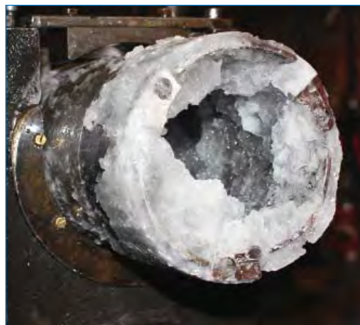
Озерная вода, замерзшая в колонковой трубе бурового снаряда после проникновения в озеро Восток.

Буровой снаряд достиг поверхности озера Восток на глубине 3769,3 м вечером 5 февраля. Озерная вода вошла в скважину под давлением порядка 4 атмосфер, подняла и раздробила находящийся в колонковой трубе ледяной керн и стала быстро подниматься по скважине. Примерно через минуту после проникно-