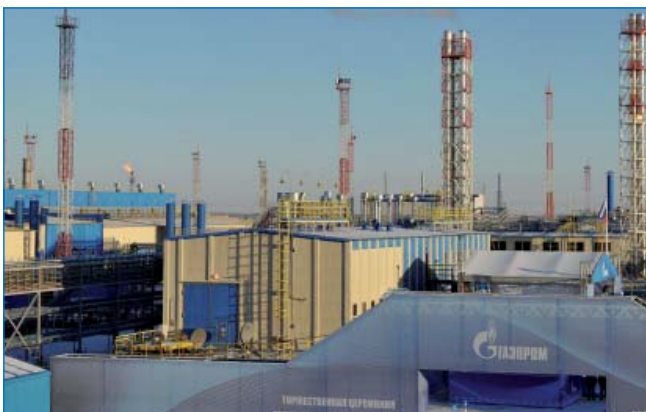
Бованенковское месторождение, ЯНАО.