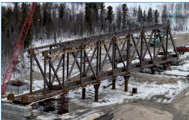
Строительство моста через р. Надым, ЯНАО (проект «Северный широтный ход»).