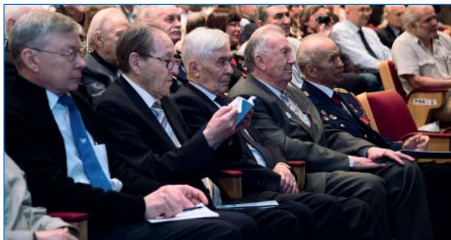
Ветераны-полярники в зале заседания.