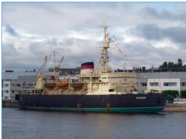
Ледокол «Красин». Год постройки: 1917.

Фестиваль ледоколов в Санкт-Петербурге стал прекрасным дополнением к проводящимся в разных странах масштабным фестивалям парусных судов. Во всем мире есть фестивали парусных судов, а в нашей стра-