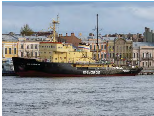
Ледокол «Иван Крузенштерн». Год постройки: 1964.