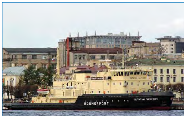
Ледокол «Капитан Зарубин». Год постройки: 1978.

не — фестивали ледоколов! Несомненно, что среди морских фестивалей ледокольный однозначно будет занимать прочное и уникальное место.