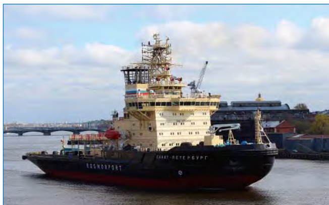
Ледокол «Санкт-Петербург». Год постройки: 2009.

Санкт-Петербурга, а также школьников, слушателей кадетских классов, клубов юных моряков и др. культурных и образовательных учреждений.