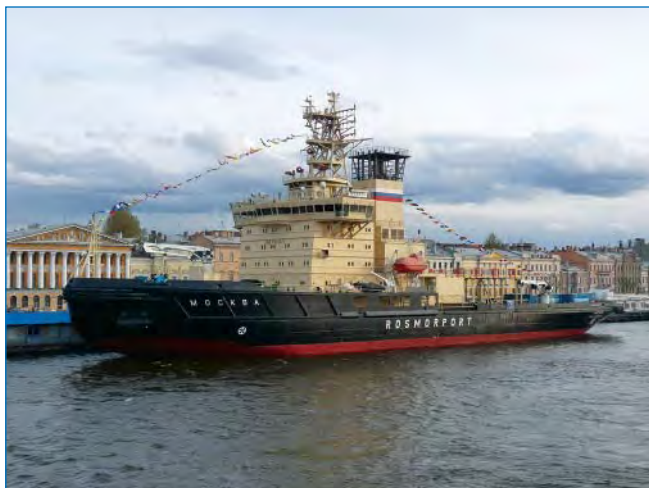
Ледокол «Москва». Год постройки: 2008.