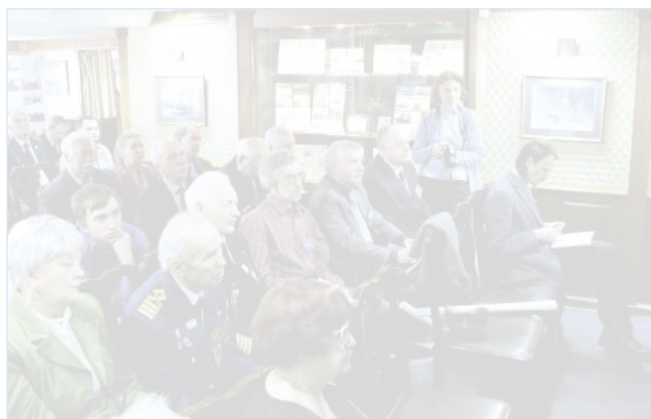
Рабочий момент совещания.