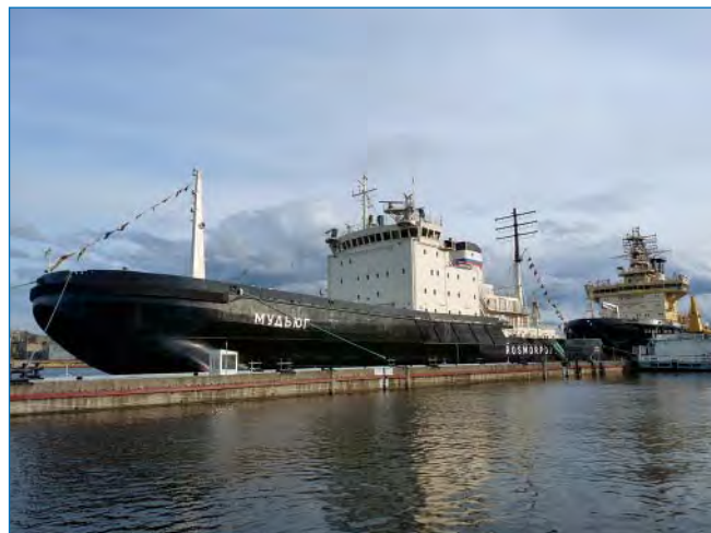
Ледокол «Мудьюг». Год постройки: 1982.

Среди целевых категорий особо следует отметить студентов и курсантов морских учебных заведений