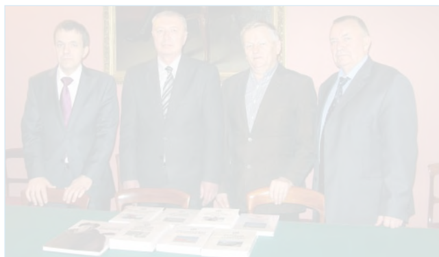
Момент передачи книжной серии в фонды РНБ.

заключение о возможности прогнозирования процессов, определяющих изменения окружающей среды полярных областей на временном масштабе десятилетий. Все это заставляет серьезно задуматься о необходимости продолжения долговременных крупномасштабных международных исследований в полярных областях Земли.