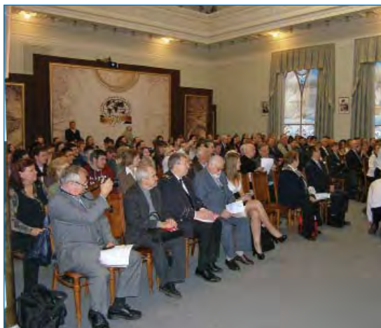
Открытие конференции. 29 сентября. Большой зал.

Программа круглых столов и семинаров конференции продолжилась 1 и 2 октября в Институте природопользования, промышленной безопасности и охраны окружающей среды на Лиговском проспекте.