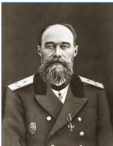
Начальник ГГУ А.И. Вилькицкий. Мыс, названный Седовым его именем, является самым северным в группе открытых им на Новой Земле географических объектов.

В 1903 году Дриженко возглавил ГЭ СЛО, причем его помощником в экспедиции был Седов. Однако ледовая обстановка в том году не позволила «Пахтусову» дойти до намеченных целей. В 1904 году экспедиция, пройдя в Карское море и продвигаясь с описью побережья вдоль Ямала, обошла остров Белый и закончила работы у входа в Обскую губу. В последующие годы Дриженко занимался гидрографическими исследованиями Белого и Каспийского морей и был начальником съемки Мурманского берега. Опубликовал более 50 научных работ. В 1917 году он был удостоен звания генерала Корпуса гидрографов и вышел в отставку. Дриженко был самым близким Седову человеком среди его коллег — покровителем, наставником, а также его начальником в двух гидрографических экспедициях. Именем Дриженко Седов назвал мыс на западном берегу северного острова Новой Земли, который находится южнее мыса Вилькицкого.