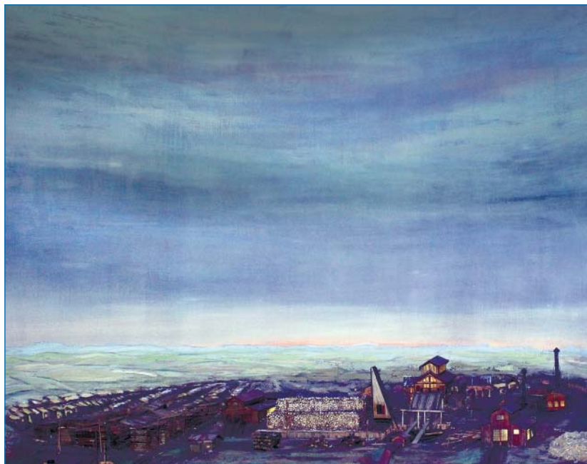
Фрагмент диорамы «Порт Игарка».

Интервью подготовлено редакцией РПИ.