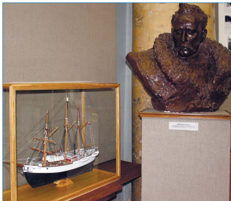
Фрагмент экспозиции, посвященной экспедиции на судне «Фрам».

Еще один раздел будет коренным образом изменен в ближайшем будущем — раздел, посвященный Ф. Нансену и его экспедиции на судне «Фрам» в 1893–1896 годах. В нем по-