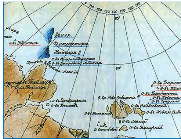
Очертания Северной Земли до 1930 года