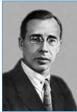
Н.Н. Урванцев. 1920-е годы

Организовав продолжение горных работ, Урванцев занялся обследованием озерно-речной системы к северу от Норильска. В ноябре 1921 года были обследованы река Норилка и озеро Пясина до истока реки Пясины. Путем промера и по желобу в ледяном покрове был найден фарватер. В Норилке глубины везде превышали 2 м, на озере не опускались ниже 1,5–2 м. В июне на рыбацкой лодке Урванцев отправился на обследование самого северного участка водной системы — реки Пясины. В экспедиции изъявил желание участвовать знаменитый промышленник Никифор Бегичев, намеревавшийся выбрать в районе устья Пясины место для зимовки организуемой им промысловой артели. Весь поход до устья Пясины, в процессе которого велись промер глубин, топографическая съемка берегов, создание астрономических пунктов, геологические наблюдения, продолжался полтора месяца. В результате тщательного обследования была установлена судоходность Пясины на всем ее протяжении, что существенно повысило промышленные перспективы норильских месторож-