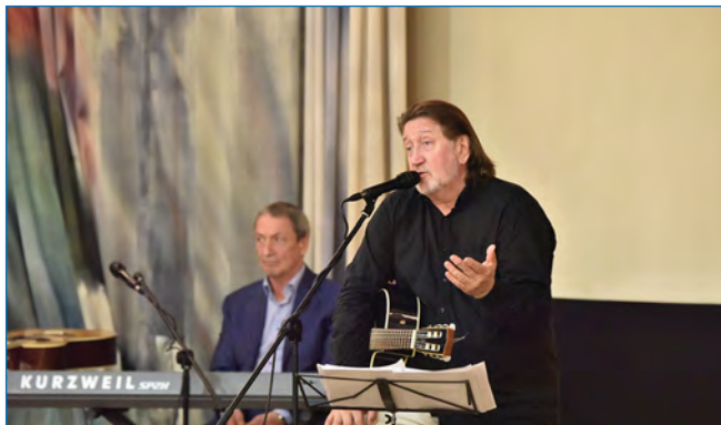
Выступление Олега Митяева