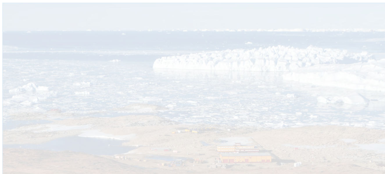
Станция Прогресс под осенним солнцем.

как опорную базу для отечественных геолого-геофизических исследований. Для новой станции было выбрано место в пяти километрах от старой. Это место и сама станция получили название Прогресс-2, а за местом старой станции закрепилось имя Прогресс-1. В период 34-й САЭ в 1989 году началось строительство нового комплекса станции. В 1991 году здесь появились двухэтажное служебно-жилое здание