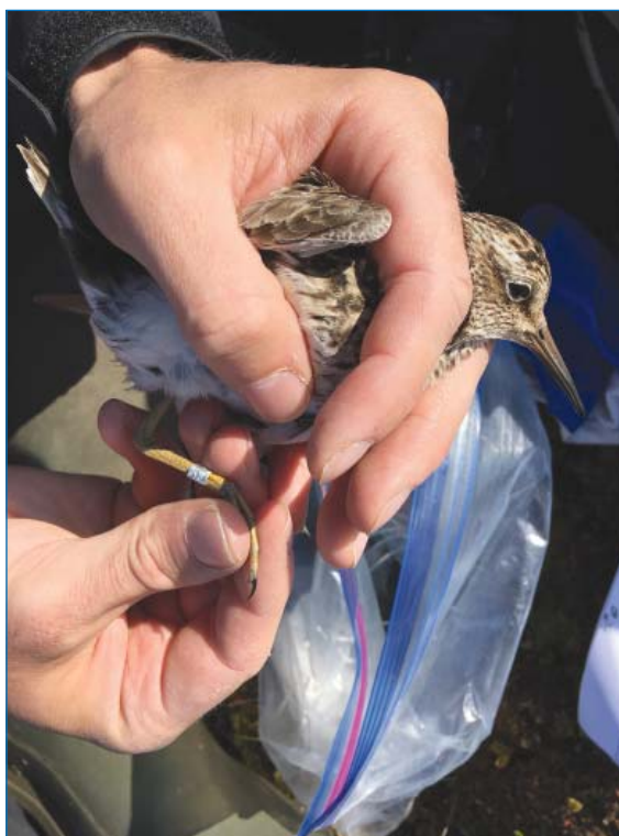
Самка дутыша с кольцом