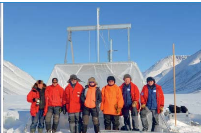
Вид на озеро Большое Щучье (слева) и группа российских, немецких и норвежских исследователей на льду озера Большое Щучье с буровым оборудованием (справа)