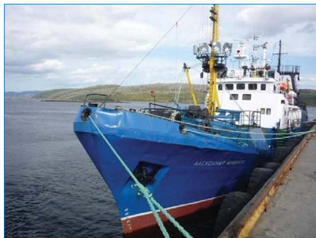
НПС «Александр Машаков».