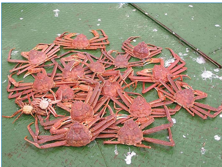
Краб-стригун опилио на палубе НПС «Александр Машаков»