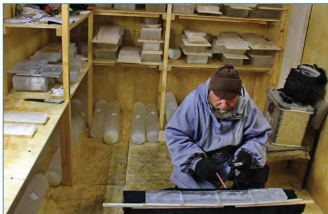
Рис. 5. Изучение текстуры льда в «холодной» ледовой лаборатории

были установлены компьютеры для приема и обработки данных с сейсмических датчиков. Оборудовано место для отдыха сотрудника во время круглосуточных наблюдений. На сегодняшний день ледовый павильон является местом организации различных ледовых наблюдений, подготовкой для этих целей оборудования, складирования и обработки образцов льда. Уже сейчас ясно, что при таком стремительном развитии ледовых исследований, какое наблюдалось в последние три года, увеличении объемов обрабатываемого льда и обеспечивающего ледовые исследования оборудования площади ледового павильона становится недостаточно. Пока не хватает специального оборудования для распиловки льда, изготовления шлифов, не хватает профессиональной фотолaborатории, способной функционировать в условиях низких температур. Но с каждым годом состояние дел в этой области заметно улучшается, что способствует развитию дальнейших работ.