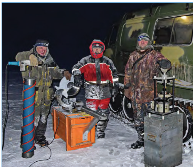
Рис. 1. Ледоисследовательские работы на контрольной точке основного ледового полигона полярной ночью

ке ледяного покрова организуется полигон, где проводятся измерения высоты снежного покрова, толщины льда и превышения поверхности льда над поверхностью моря. Одновременно на контрольной точке выполняется серия измерений физических свойств льда (рис. 1). К измерениям температуры и солёности, проводившимся с 2014 года, добавились измерения плотности и предела прочности на изгиб круглых пластин на прессе ПИМ. Обязательно проводится структурно-текстурный анализ льда на всю его толщину. Подобный подход позволяет не только проследить изменение метрических параметров льда и его физических свойств, строго привязанных к его строению, в течение одного сезона ледостава, но и отследить межгодовые колебания этих параметров.