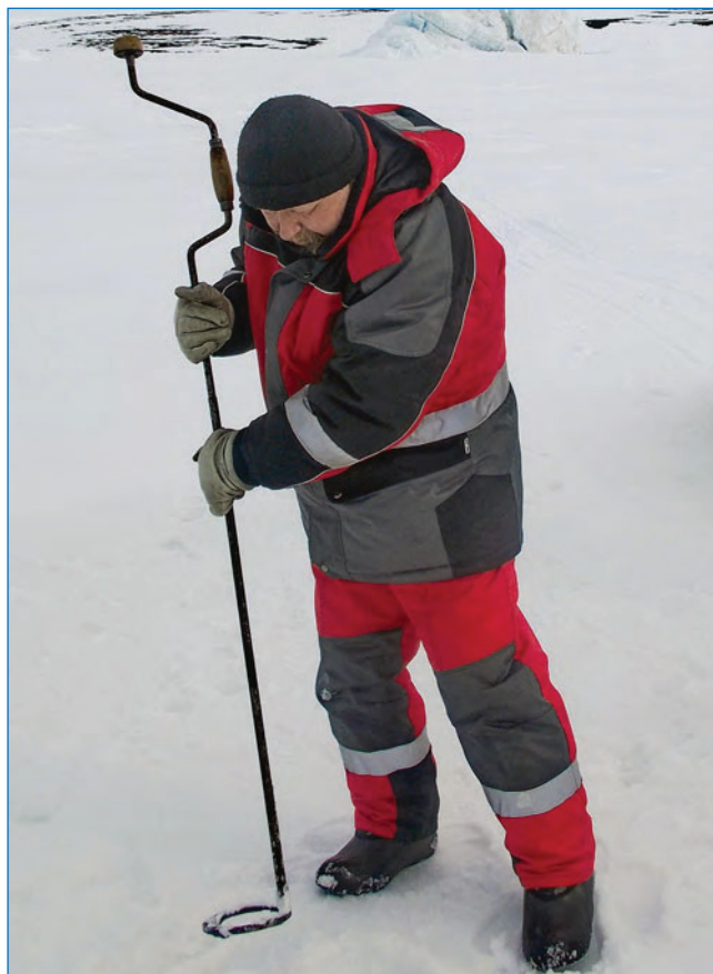
Рис. 4. Бурение льда кольцевым буром Черепанова

Именно тогда стало хорошо видно, что лед по своему строению меняется в зависимости от изменений процесса формирования ледяного покрова. Появилась необходимость всестороннего изучения строения льда и развития методики структурно-текстурного анализа. Методика изучения строения морского льда, состоящая из изготовления вертикальных и горизонтальных пластин толщиной около 2 см, а также тонких пластин толщиной меньше 1 мм и их просвечивания в поляризационном свете для выявления кристаллического строения льда, мало изменилась до сегодняшнего дня. Сейчас отбор проб льда осуществляется с помощью механических керноотборников, что позволяет значительно увеличить количество кернов для дальнейшего анализа. Поскольку подготовка образцов льда к текстурно-структурному анализу требует специальных условий, оборудования и времени для анализа, возникает необходимость в специальном помещении с отрицательными температурами для хранения и обработки отобранных проб (рис. 5). Весной, со второй половины мая, на архипелаге Северная Земля температуры воздуха начинают приближаться к положительным значениям. Именно этим сроком и ограничивается возможность работы со льдом в лаборатории без холодильной установки, в то время как припайный лед сохраняется до августа, а в отдельных случаях остается на следующий год. В результате процессы интенсивных изменений во льду, связанные с термометаморфизмом в весенне-летний период, которые находят отражение в изменении текстуры