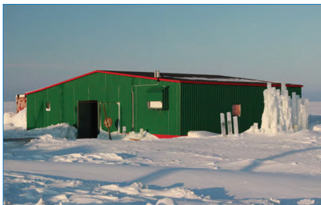
Рис. 3. Ледоисследовательский павильон в 2018 году

на поверхность, на сленге ледоисследователей — «кабаны». Трудоемкая работа с «кабанами» занимала много времени и сил. С появлением кольцевого бура «ПИ-8» (рис. 4) разработки Н.В. Черепанова упростился отбор проб льда, что позволило перейти от точечных исследований физических свойств льда к площадным съемкам.