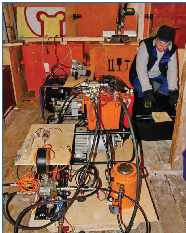
Рис. 6. Монтирование комплекса зонд-индентора на сани в центральном зале ледового павильона

В.А. Бородин, В.Т. Соколов, С.М. Ковалев, И.А. Кушеверский (ААНИИ).