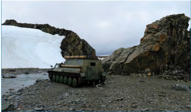
Выезд на полевые работы на ГТС в устье реки Амба.