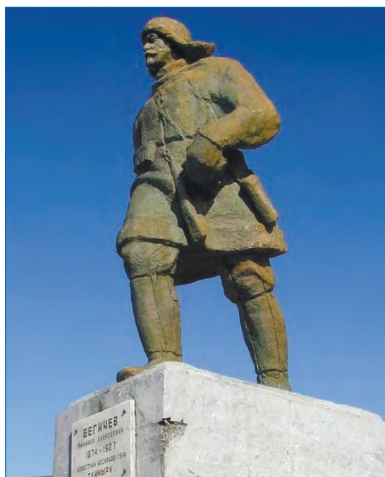
Памятник Н.А. Бегичеву в Диксоне

Именем Бегичева названы два острова (Большой и Малый Бегичев) мористее Хатангского залива, остров (Бегичевская Коса) в дельте реки Пясины на Таймыре и озеро севернее бухты Марии Прончищевой на Таймыре.