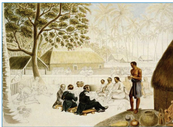
Завтрак у короля Таити. Аквадель из альбома П.Н. Михайлова.

После исследования Полинезии экспедиция вновь вернулась в Австралию, чтобы произвести окончательную починку судов и пополнить необходимые припасы, после чего отправилась вновь к Антарктиде, чтобы совершить второй этап своего плавания. Но об этом — в следующей, заключительной статье.