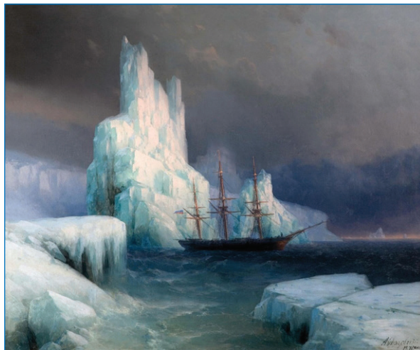
Ледяные горы в Антарктиде. И.К. Айвазовский

и было совершено молебствие с коленопреклонением. Праздничным блюдом стали щи — «любимое кушанье русских» — из свежей свинины с кислой капустой и пироги с рисом и рубленным мясом. Рядовым выдали по полкружки пива, а после обеда — пунш из рома с сахаром и лимоном, что сильно подняло настроение