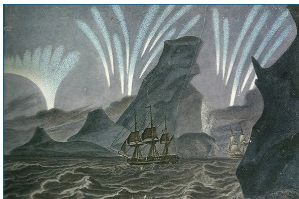
Южное сияние. Акварель из альбома П.Н. Михайлова

В начале января поиски Антарктиды среди ледяных полей шли полным ходом. Попутно велась активная охота на пингвинов, чье мясо употреблялось на судах в пищу и было оценено положительно. 27 января экспедиция пересекла южный полярный круг. На следующий день, 28 января 1820 года Беллинсгаузен описал свои наблюдения: «льды, которые