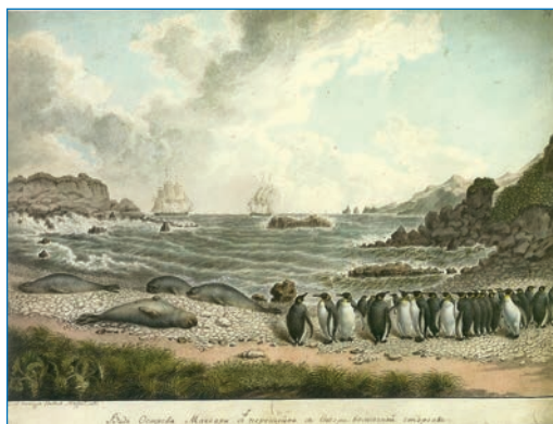
Вид острова Маккуори с северо-восточной стороны. Акварель из альбома П. Михайлова

Постепенно открывались люки, проветривались каюты. 27 февраля суда бросили якорь в Рио-де-Жанейро, где начался ремонт кораблей. Лишь 23 апреля экспедиция взяла курс на Лиссабон, куда их пригласил португальский король Жуан VI во время своего пребывания в Бразилии. В конце июня экспедиция повстречалась с королевской эскадрой у берегов Португалии. Через четыре дня «Восток» и «Мирный» уже отправились в Россию, куда прибыли 24 июля 1921 года, отсалютовав Кронштадту. Экспедиция провела в пути 751 день и принималась лично императором Александром I. Наградой Ф. Ф. Беллинсгаузена за эту экспедицию был чин капитан-командора, орден Св.