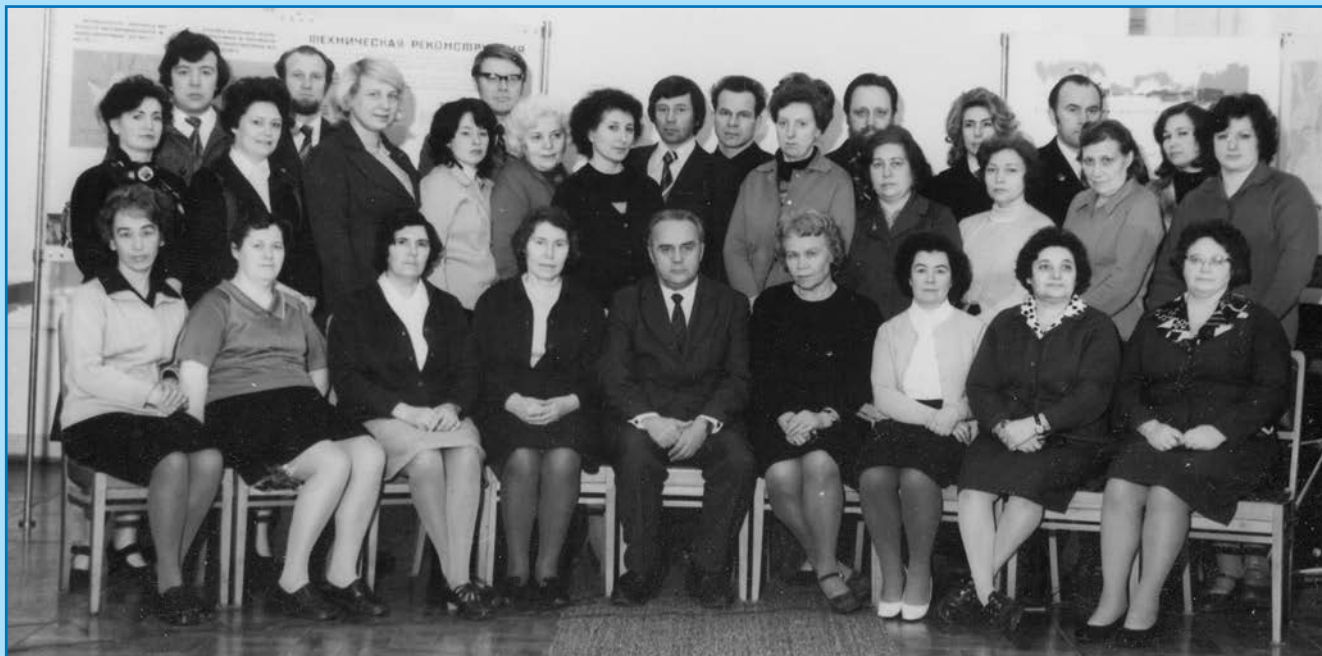
Коллектив ОДМП. 1974 год

9. Изучены закономерности многолетних колебаний форм атмосферной циркуляции и связанных с ними изменений климата полярной области в целях предвидения длительных тенденций в изменении характеристик