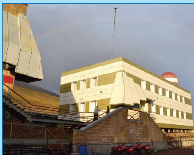
«Научный городок» в пос. Баренцбург

РАЭ-Ш также проводит большую организационную работу в интересах всего РНЦШ: отвечает за подготовку и согласование ежегодной «Межведомственной программы научных исследований и наблюдений на архипелаге