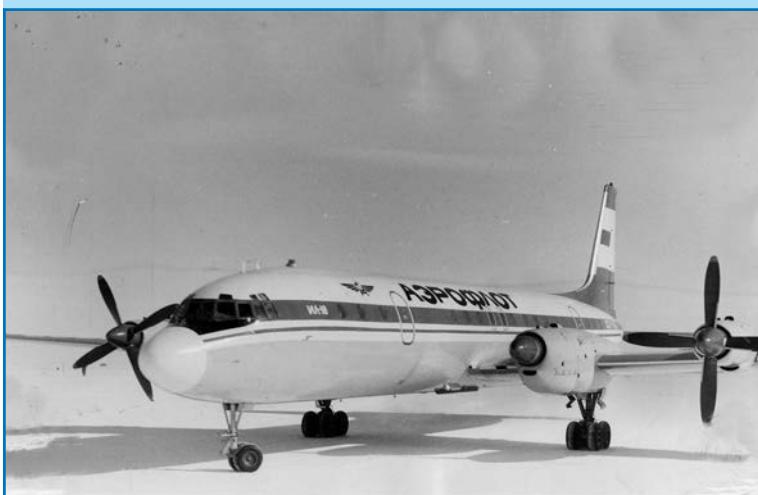
Первая посадка на колесах Ил-18Д на аэродром АМЦ Молодежная