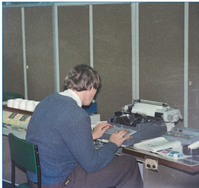
Работа в ночную смену на ЭВМ проводилась самостоятельно, без оператора

Вклад вычислительного центра ААНИИ в общие результаты работы института был и большим и важным, работа велась по следующим направлениям: