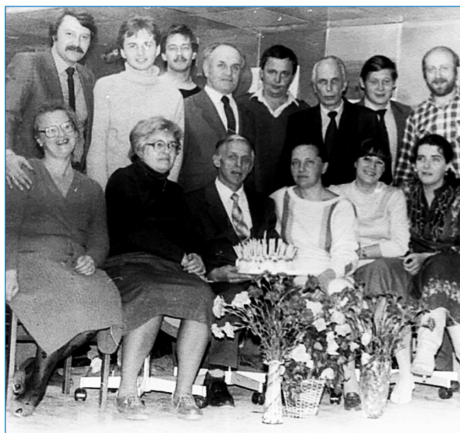
Коллектив ВЦ. Вторая половина 1980-х годов