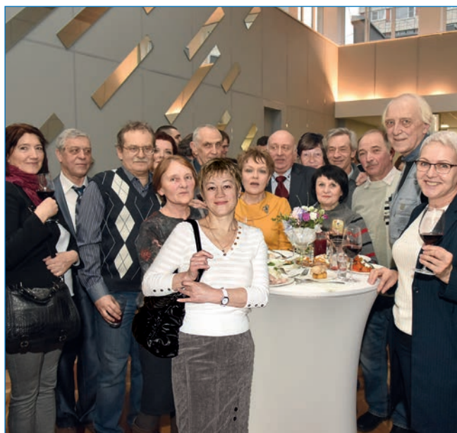
Коллектив ВЦ на праздновании 100-летия ААНИИ

Ю.А. Гродецкий (бывший сотрудник ВЦ).