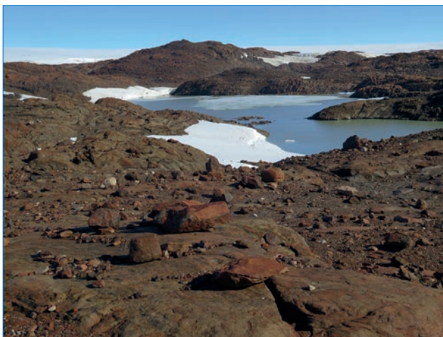
Ландшафт оазиса Бангера

В материалах этого года, собранных в юго-восточной части оазиса, пока не удалось обнаружить 26 видов