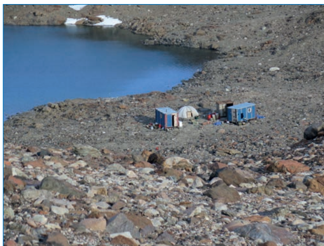
Лагерь полевой партии в оазисе Бангера

Участники полевого отряда жили в двух небольших балках, один из которых служил жильем и рабочим местом для четверых, а во втором, кроме спальных мест и рабочего кабинета для