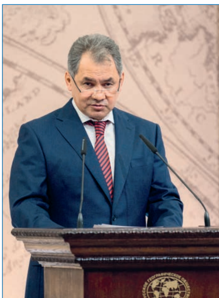
Президент Русского географического общества С.К. Шойгу

Полярное направление деятельности РГО всегда имело особое значение. Среди основателей РГО полярными исследованиями занимались Ф.П. Литке и Ф.П. Врангель. Еще в императорский период важным событием стало создание Постоянной комиссии общества по изучению Арктики. Результатом ее работы была организация Чукотской, Якутской и Кольской экспедиций. РГО стало одним из организаторов и участников первого Международного полярного года, в ходе которого были созданы автономные полярные станции в устье