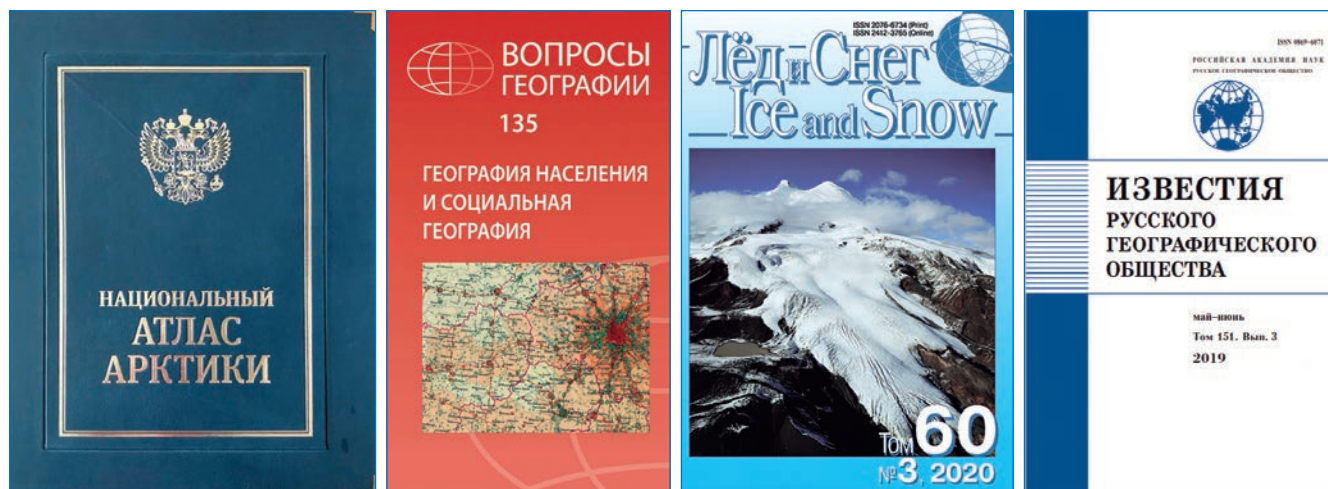
Издательские проекты РГО

Кроме реализации постоянных издательских проектов РГО (журналы «Известия Русского географического общества», «Лед и снег», «Geography, Environment, Sustainability», сборники «Вопросы географии»), печатаются монографии и атласы (например, «Национальный