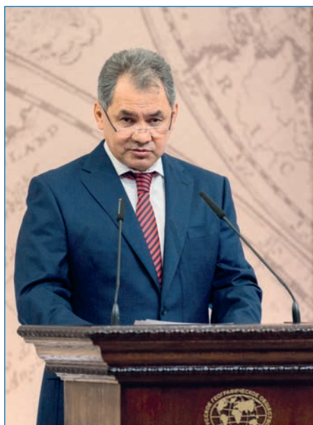
Президент Русского географического общества С.К. Шойгу

Полярное направление деятельности РГО всегда имело особое значение. Среди основателей РГО полярными исследованиями занимались Ф.П. Литке и Ф.П. Врангель. Еще в императорский период важным событием стало создание Постоянной комиссии общества по изучению Арктики. Результатом ее работы была организация Чукотской, Якутской и Кольской экспедиций. РГО стало одним из организаторов и участников первого Международного полярного года, в ходе которого были созданы автономные полярные станции в устье