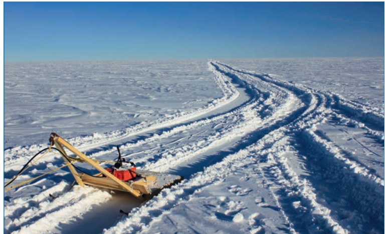
Санки с радаром во время похода

ности снега, отбора проб для измерения его изотопного и химического составов. Благодаря энтузиазму механиков-водителей, которые активно помогали выполнять все работы, на каждую такую остановку уходило всего лишь около 7–8 минут. Продвижение похода по этой неизведанной территории шло без проблем (несмотря на опасения встретить зону рыхлого снега, в которой тягачи могли увязнуть), средняя скорость движения составила 9,7 км/ч.