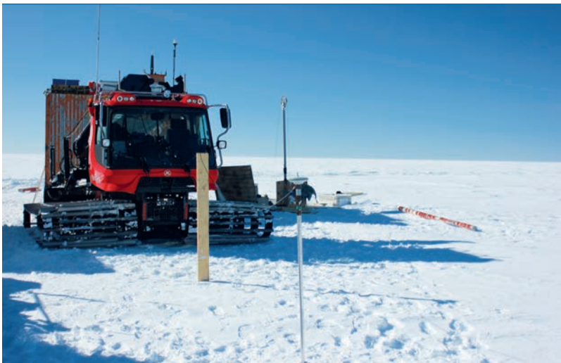
Стационарные геодезические наблюдения на Ледоразделе Б. На заднем плане видна буровая установка

С первых же минут началось выполнение двух пунктов программы — кинематической GNSS-съемки и радарного профилирования. Помимо этого, каждые 5 км делались остановки для выполнения гляциологических работ — установки снегомерной вехи, измерения плот-