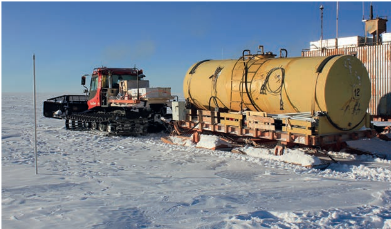
Научный поход во время движения от Востока к Ледоразделу Б

ческая задача была для России невыполнимой. Благоприятные обстоятельства сложились в сезон 65-й РАЭ, когда в районе Востока начались работы по подготовке пятна застройки нового зимовочного комплекса, для чего на станцию были доставлены несколько единиц новых тягачей Pisten Bully Polar 300.