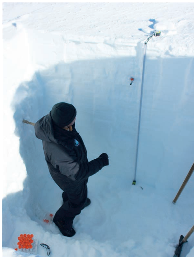
Гляциологические работы в шурфе

27 января было закончено бурение мелкой скважины до глубины 20,5 м с извлечением керна, а на дне скважины измерена температура фирна. Был разбит геодезический полигон, состоящий из четырех вех, установленных на расстоянии 5 км к северу, западу, югу и востоку от лагеря. Повторное точное измерение положения и высоты этих вех во время будущих экспедиций позволит определить динамику ледника и уточнить положение топографического купола.