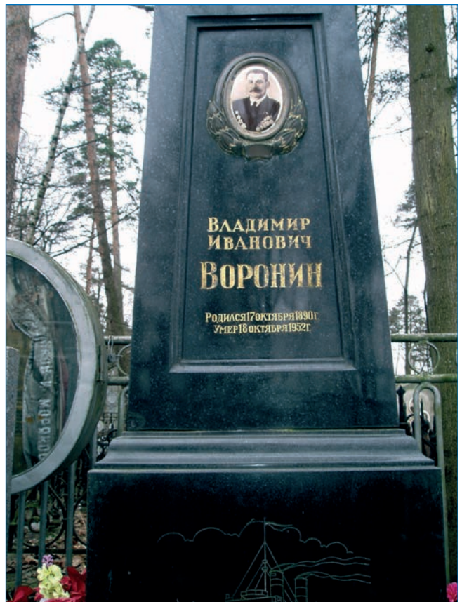
Могила В.И. Воронина на Шуваловском кладбище

Г.П. Аветисов (ВНИИОкеангеология).