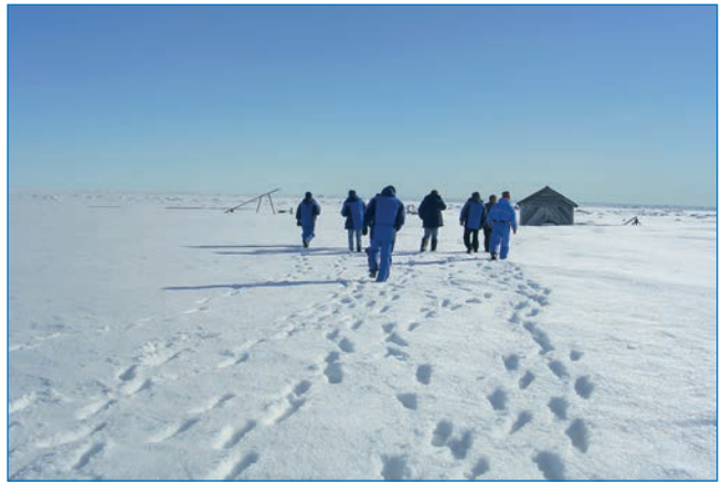
Остров Воронина в восточной части Карского моря

Заслуги капитана Воронина отмечены рядом трудовых и боевых правительственных наград, в том числе двумя орденами Ленина. Его имя носят шесть объектов в Арктике: остров в восточной части Карского моря, мыс на востоке острова Солсбери архипелага Земля Франца-Иосифа, ледник на острове Гукера архипелага Земля Франца-Иосифа, бухта в заливе Русская Гавань на западном побережье острова Северный архипелага Новая Земля, губа в губе Черная и залив в губе Саханина на западном побережье острова Южный архипелага Новая Земля.