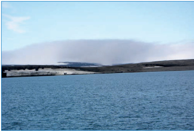
Бухта Воронина в заливе Русская гавань

Тяжелая болезнь заставила Воронина прекратить ледовые походы после 1939 года. Война застала его в Ленинграде, откуда он был эвакуирован в Ульяновск. В столь суровое для страны время заслуженный капитан не мог оставаться в стороне от практической деятельности. Он добился переосвидетельствования, получив справку: «Плывать в Арктике может, простужаться нельзя». В начале 1942 года Воронин начал военную службу в Архангельске: читал лекции, обучал военных лоцманов, а летом в качестве старшего лоцмана участвовал в проводке военных кораблей по Северному морскому пути. В период 1943–1946 годов он командовал ледоколом «Иосиф Сталин».