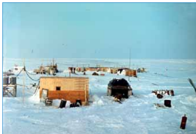
«Стационар-полигон Д» (о. Октябрьской Революции, арх. Северная Земля), 1983 год