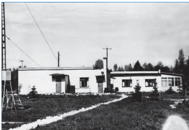
Ладожская научно-испытательная станция. 1970-е годы

В отделе велись исследования структуры, физико-механических, теплофизических, акустических, оптических и электрических характеристик морских и пресноводных льдов, ледниковых покровов суши и снежного покрова Арктики и Антарктики, а также состояния и изменчивости гидрофизических полей полярных акваторий. Сотрудники применяли разнообразные средства и методы исследований — контактные и дистанционные, основывающиеся на достижениях радиофизики, сейсмоакустики, электроники и т. д. В состав отдела также входила Ладожская научно-испытательная станция, где проводились испытания создаваемых в отделе приборов перед применением их в Арктике и Антарктике, а с 1981 года — «Стационар-полигон Д» (мыс Ватутина на о. Октябрьской Революции, архипелага Северная Земля, где работала экспедиция А-162Д).