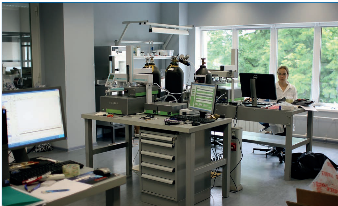
Лаборатория ЛИКОС оснащена самым современным оборудованием

российскими и зарубежными научными коллективами. На базе ЛИКОС осуществлялись совместные исследования ААНИИ, МГУ, ИГ РАН и Тюменского государственного нефтегазового университета по проекту МАГАТЭ «Стабильные изотопы воды в криосфере северной Евразии», а также исследования по программам МАГАТЭ-ВМО «Глобальная сеть изотопов в осадках и реках» (ГСИО и ГСИР), которые включали мониторинговые проекты в Тикси, на мысе Баранова (Северная Земля) и на архипелаге Шпицберген. Большой объем изотопных анализов был выполнен по программе СПбГУ, связанной с мониторингом алтайских ледников России и Монголии, а также по проекту РГО «Постоянная комплексная ладожская экспедиция».