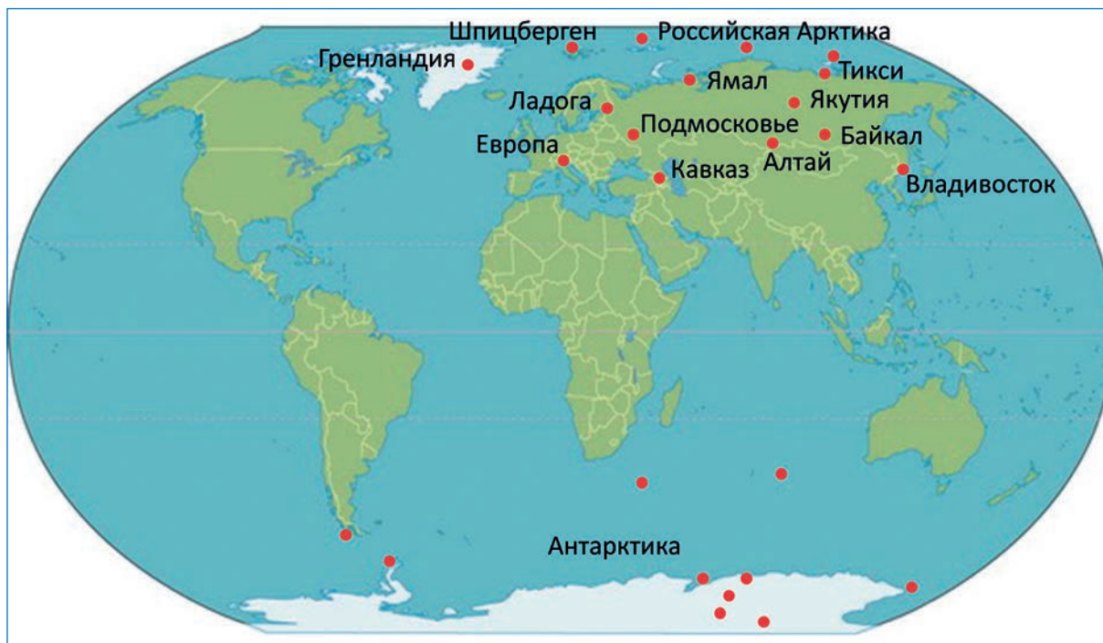
География исследований ЛИКОС ААНИИ

Международное сотрудничество содействовало вовлечению специалистов ЛИКОС в исследования глубоких ледяных кернов, полученных в ходе реализации крупнейших европейских буровых проектов в Антарктиде (проекты EPICA, Беркнер, Флетчер, Купол Талос) и Гренландии (NEEM). Сотрудники лаборатории принимали участие в сезонных полевых работах на американской антарктической базе Мак-Мердо и франко-итальянской внутриконтинентальной станции Конкордия, а также в работах по гренландскому буровому проекту EastGRIP. В рамках деятельности МАЛ ЛИКОС участвовала в международном проекте Память ледников (Ice Memory), полностью