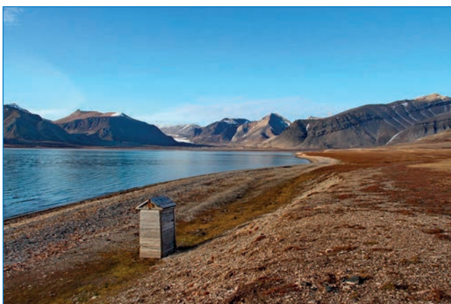
Горы Фараофьеллет, Хеопсфьеллет, Менкаурафьеллет