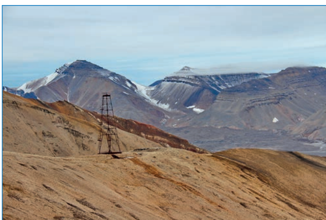
Горы Хеопсфьеллет, Менкаурафьеллет, Хефренфьеллет

Именем жены Одина, верховной богини Фригг, названы ледник Фриггкопа и горы Фриггфьелла, среди которых две горные вершины — Гно и Фулла, так звали служанок богини.