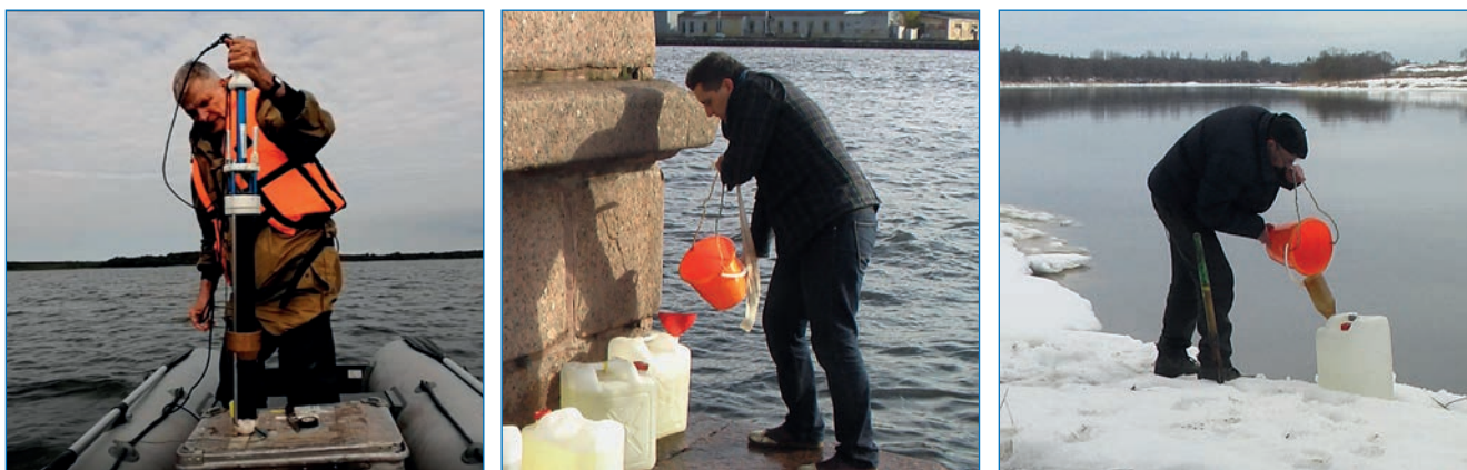
Отбор проб воды и донных отложений из Ладожского озера (слева), реки Невы (в центре), реки Волхов (справа)

статочно для распада в захороненном объекте. Иная ситуация в будущем ожидает объекты, содержащие ^{239,240}\text{Pu} (плутоний) и другие трансурановые радионуклиды с полупериодами распада тысячи лет. Есть надежда на успехи науки в совершенствовании методов и технологий консервации и утилизации трансурановых радионуклидов. Они позволят решать вопросы обращения с такими отходами атомной промышленности и судов с ядерными реакторами. Результаты регулярного мониторинга вод и донных отложений возле захороненных объектов с РАО в Карском море могут (при необходимости) послужить основанием к подъему захороненного объекта со дна моря или принятию мер купирования выхода ИРН в морскую среду.