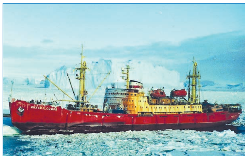
НЭС «Михаил Сомов» в море Космонавтов, декабрь 1991 года

ная телеграмма: «КОРАБЛЮ ЭКСТРЕННО СЛЕДОВАТЬ НАЗАД В АНТАРКТИДУ К СТАНЦИИ МОЛОДЕЖНАЯ ДЛЯ ЭВАКУАЦИИ БОЛЕЕ 150 ПОЛЯРНИКОВ...», т. к. на Молодежной в связи с задержкой НЭС «Академик Федоров» оставалось на зимовку более 300 человек. «Михаил Сомов» простоял в Монтевидео еще 1,5 месяца в ожидании прибытия из СССР НИС «Профессор Визе» для приема полярников и смены части личного состава на НЭС «Михаил Сомов». Лишь в конце июня «Михаил Сомов» взял курс к шестому континенту — туда, где в это время года уже наступила полярная ночь, не было ни одного корабля и свирепствовали жестокие вьюги.