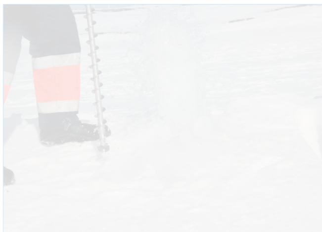
Фонтан газирующего рассола на арх. Северная Земля.