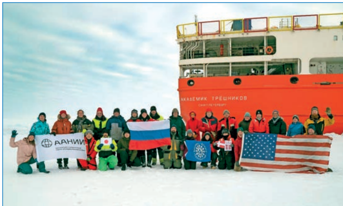
Участники экспедиции NABOS-2021 на ЭС «Академик Трёшников».

нения климата высоких широт Арктики. Также они позволят повысить точность прогнозирования и пространственно-временную детализацию рассчитываемых параметров с помощью математических моделей, что улучшит качество гидрометеорологического обеспечения морской деятельности в Арктике, включая акваторию Северного морского пути.