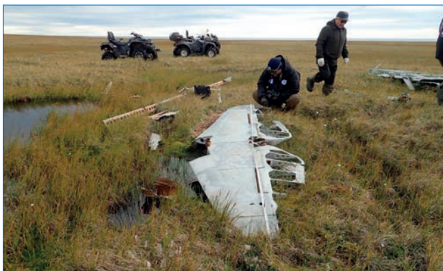
Остатки самолета в 8 км на юго-запад от ВПП в Уэлькале.

Истребитель на ВПП с деревянным покрытием в Уэлькале (Негенбля И.Е. Аляска – Сибирь. Над тундрой и тайгой. Якутск: Бичик. 2005. С. 53) была развернута военная часть, которая просуществовала до начала 2000-х годов. В районе ВПП зафиксированы большие объемы мусора, бочек, остатков различной техники, тянущиеся по косе на расстоянии не менее 3 км. Все это требует очистки, но обязательно с участием специалистов-историков. В районе ВПП зафиксированы остатки двух самолетов — один в лагуне и второй примерно в 8 км на юго-запад (местечко «на крыльях»), где обнаружен стабилизатор истребителя Як-9У (определен специалистом по авиационной технике С.А. Закурдаевым) и фрагменты сильно коррозированных труб из алюминия, гофры.