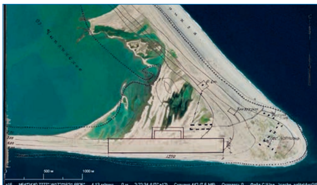
Наложение схемы аэропорта Чаплино военного времени и современного космоснимка. Выполнено П.А. Филиным

ческих процессов — с юга, там, где располагалась ВПП, коса «подъедена» морем, с северо-востока, наоборот, коса narосла. Сейчас историческая ВПП перекрыта береговым валом.