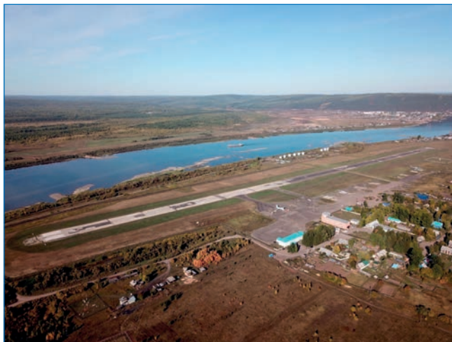
Вид на аэродром г. Киренска.

Изыскания, проектирование и постройка аэродрома начались зимой 1941/42 года, летное поле 1200×120 м с приаэродромной инфраструктурой сданы в эксплуатацию 1 января 1943 года.