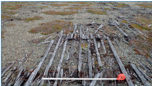
Остатки ВПП с деревянным покрытием в Уэлькале.