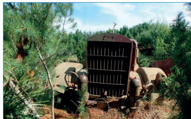
Американский тягач REO 29-XS (F-1) в районе аэродрома Танюер.

Из объектов приаэродромной инфраструктуры практически ничего не сохранилось. На месте поселка стоит жилой дом метеостанции Танюер Чукотского УГМС, небольшая баня и такого же типа здание ДЭС.