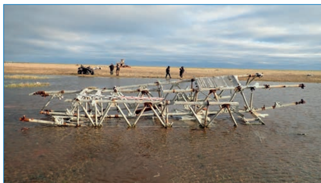
Остатки самолета на косе Чаплино.

Объекты приаэродромной инфраструктуры времен войны не выявлены. На косе сохранились разрушенные остатки самолета, представляющие собой каркас из сильно корродировавших алюминиевых труб и остатков авиационной гофры. Судя по стойкам шасси и общей геометрии, это могут быть остатки самолета ПС-7 (пасажирская модификация двухмоторного разведчика Р-6) конструкции А.Н. Туполева 3 .