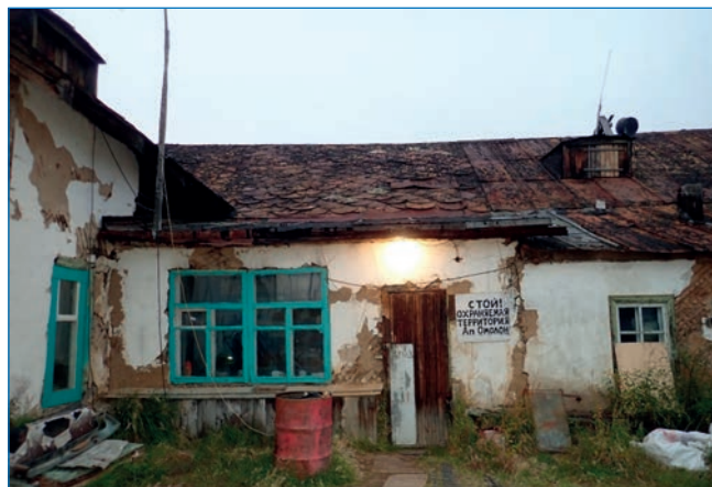
Здание гаража и крыши из американских бочек в пос. Омолон.

Из сохранившихся объектов приаэродромной инфраструктуры — здание гаража и четыре типовых жилых дома в поселке. Интересно, что крыша гаража покрыта черепицей из вырезанных крышек бочек с американскими маркировками 1944–1945 годов и листовым железом из тех же раскатанных ленд-лизовских бочек. В мастерской в рабочем состоянии станок фирмы Bradford, поступивший по программе ленд-лиза.