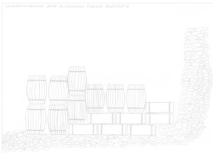
Депо Пайера. Реконструкция. Рисунок автора