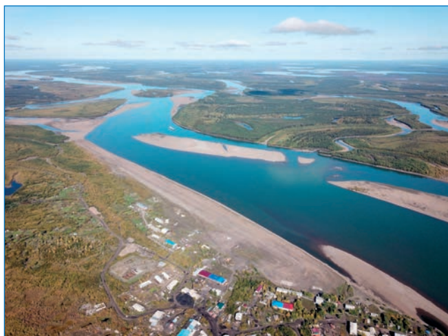
Вид на ВПП в пос. Зырянка.

грунтовая, имеет размеры 1500×40 м. Место исторической полосы, скорее всего, частично «съедено» абразией берега.