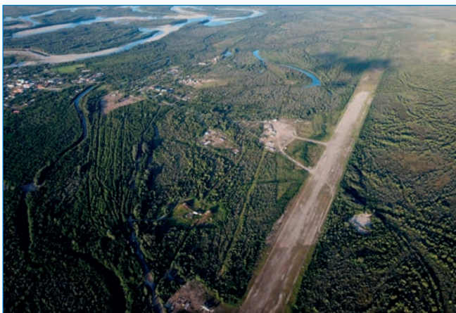
Старая и новая ВПП в пос. Марково.

Аэропорт изыскан летом 1942 года, осенью того же года была сдана во временную эксплуатацию грунтовая полоса размерами 1000×90 м. В 1944 году полоса была уложена металлическими аэродромными плитами.