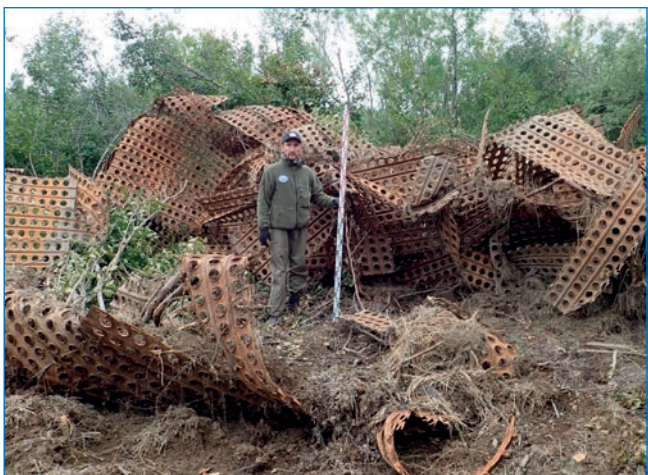
Остатки аэродромных плит на старой ВПП в пос. Марково.

Из приаэродромной инфраструктуры времен войны сохранилось здание аэропорта (КДП — контрольно-диспетчерский пункт) 1942 года постройки. Местные общественники выступают за его сохранение и создание в нем клуба-музея.