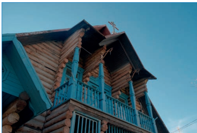
Здание гостиницы аэропорта Сусуман.

Аэропорт введен в строй в 1942 году (в то время имел название Берелёх). На современном этапе имеет статус авиаплощадки. Историческая ВПП не совпадает с современной ВПП и не используется. Старая грунтовая полоса имеет размеры 1700×100 м, до 60 % поверхности поросло кустарником высотой до 180 см.