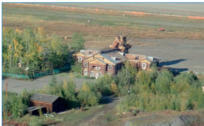
Здание аэропорта в пос. Сеймчан.

Изыскания, проектирование и строительство аэродрома начались зимой 1941/42 года. Принят в эксплуатацию 22 июля 1942 года. ВПП размером 1500×300 м. В архиве аэропорта удалось обнаружить комплект строительной документации, из которой выяснилось, что проектированием занималась контора «Колымпроект» Дальстроя.