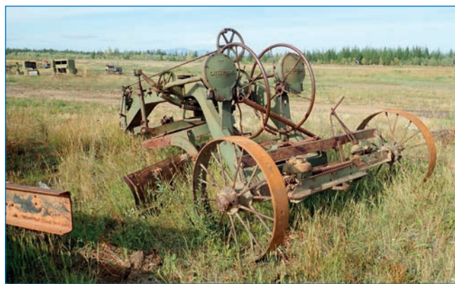
Грейдер «Катерпиллер» (Caterpillar pull grader № 33), пос. Омолон.

На аэродроме сохранился грейдер «Катерпиллер» (Caterpillar pull grader № 33), модель 1937 года, который до сих пор эксплуатируется — зимой им чистят снег.