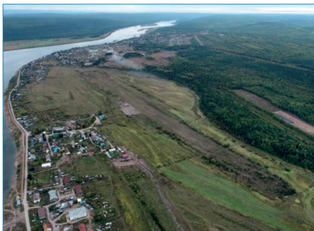
Вид на ВПП пос. Витим.

К строительству грунтовой полосы приступили в июле 1943 года, 20 октября аэродром с ВПП в направлении с севера на юг 1100×60 м был принят во временную эксплуатацию с дальнейшим расширением полосы до размеров 1200×100.