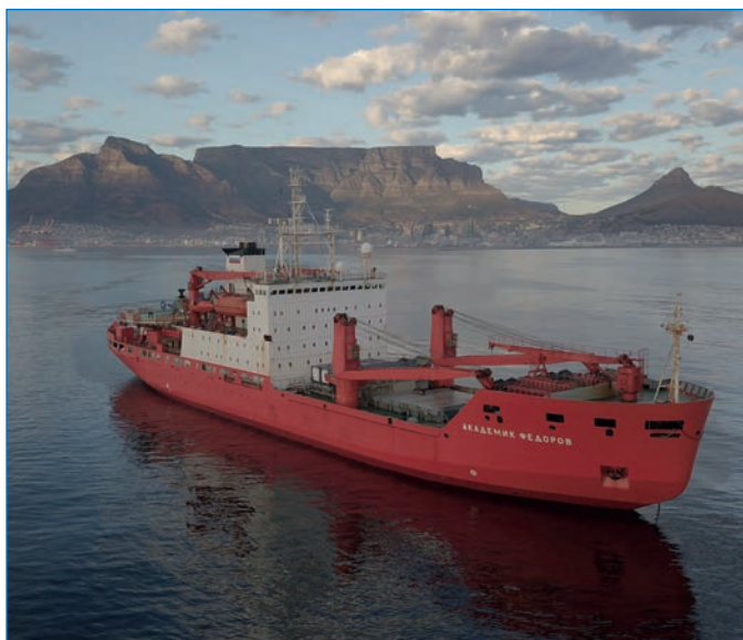
НЭС «Академик Федоров» вблизи Кейптауна.

Морские геолого-геофизические исследования будут выполняться на акватории северо-западной части моря Уэдделла (Южно-Оркнейское плато, бассейн Пауэлл, бассейн Джейн) с борта НИС «Профессор Логачев». Основная задача морских геологических работ — составление батиметрических схем морского дна на участках съемки с многолучевым эхолотом, определение состава и тектонической обстановки формирований поднятий морского дна по данным драгирования, составление сейсмостратиграфической модели осадочного чехла,