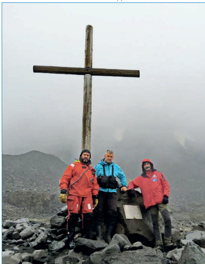
Участники экспедиции у мемориального креста.

часть архипелага, которую первоначально надеялся достичь Альбанов, чтобы далее следовать по архипелагу, пользуясь имевшейся у него картой, составленной много лет назад Фрильфом Нансеном. «Альтер Эго» прибыл на самые северные острова архипелага, произвел высадки на островах Ева-Лив, Рудольфа и Гогенлоэ. Остров Ева-Лив впервые был обследован нами с северной части, там, где ранее находился полуостров Месяцева, ныне отделившийся в самостоятельный небольшой островок. Характер побережья указывал на то, что динамические процессы на береговой линии вряд ли позволят обнаружить какие-то артефакты, даже если бы они были вынесены на остров.