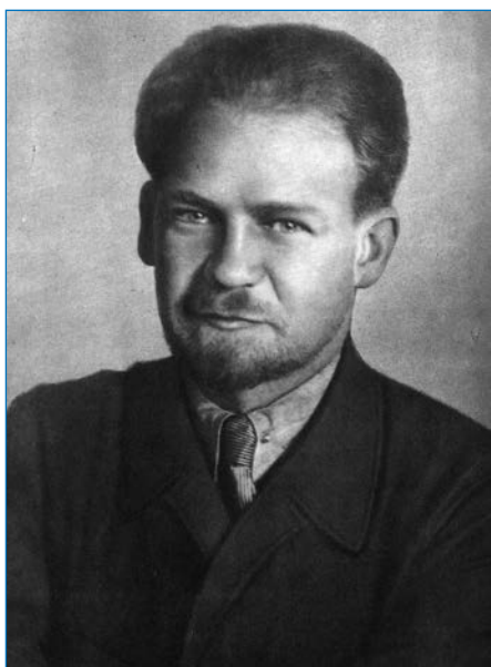
В.В. Чернолуцкий. Фото из архива Российского этнографического музея

с кочующими оленеводами, в результате чего выполнили ценные этнографические наблюдения.