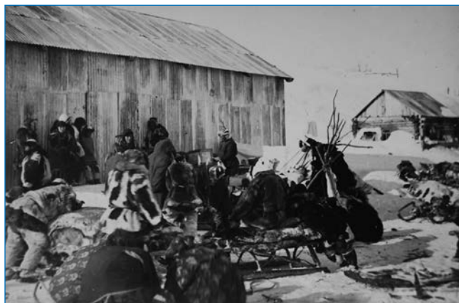
Анадырско-Чукотская экспедиция. Уголок ярмарки в Анадыре. 1931–1932 годы.

Этнографы Травины в ходе экспедиции изучали жизнь зырян и русских в среднем течении р. Печоры. Они собрали три ящика этнографических коллекций, начали составление словаря местного русского наречия и изучение духовной и общественной жизни местного населения, а также делали рисунки и фотографии местных жителей. В 1922 году, несмотря на отсутствие финансирования и фотографической техники, работы в устье р. Мезень продолжались. Этнографам удалось собрать материал по русскому фольклору.