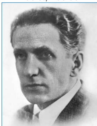
Г.Н. Прокофьев.