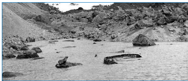
Брошенная шляпка на острове Буве

вал остров под 6° восточной долготы и, как выяснилось через полтора века, ошибся на 250 километров. В течение XIX века остров неоднократно открывали снова; только в 1898 году был признан приоритет Буве, и остров (который сейчас принадлежит Норвегии) был назван его именем.