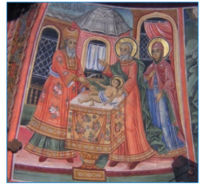
Русская икона Обрезание Господне

В те времена приборы для измерения долготы были весьма несовершенны. Жан Буве зарегистриро-