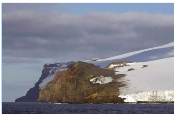
Мыс Сирконсисьон (фр. Cape Circnconision ), остров Буве

Так остров стал зависимой территорией Норвегии и сменил название с «Ливерпульского» на свое современное в честь первооткрывателя французского мореплавателя Жана-Батиста Шарля Буве де Лозье.