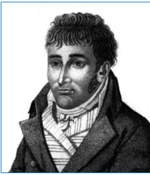
Жан-Батист Шарль Буве де Лозье (1705–1786)

французы прилагали максимум усилий к поиску заветной земли.