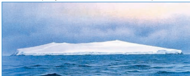
Остров Буве похож на обломок гигантского айсберга