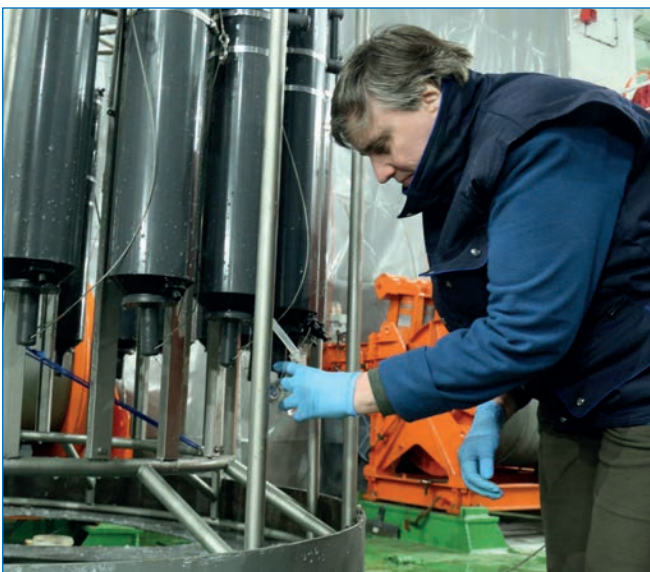
Гидрохимик за работой с розеткой

– термохалинное профилирование с борта судна с отбором проб морской воды с 24 горизонтов при помощи пробоотборника SBE32 SC;