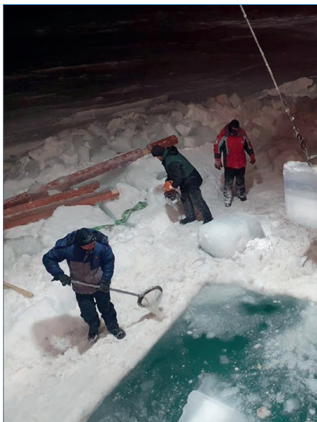
Подготовка майны у борта ЛСП