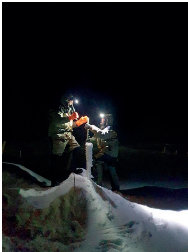
Исследовательские работы продолжаются несмотря на полярную ночь. Полярники выполняют измерение толщины льда

– регистрация скоростей течений на вертикальном профиле акустическим доплеровским профилографом течений NORTEK-AS на океанографическом терминале.