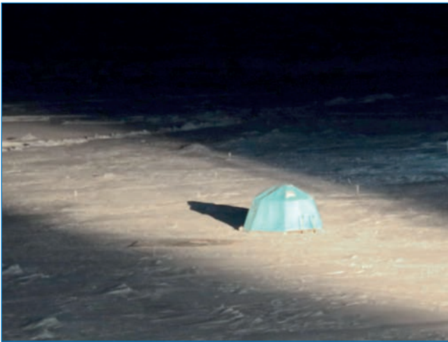
Выносной исследовательский пункт