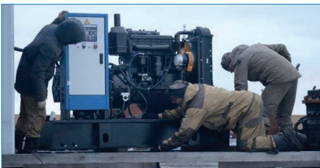
Новый дизель-генератор на станции МГ-2 Известий ЦИК