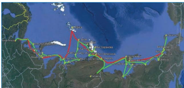
Маршрут НЭС «Михаил Сомов» по трассе СМП в 2022 году. Зеленой линией обозначен путь на восток, красной – обратно на запад