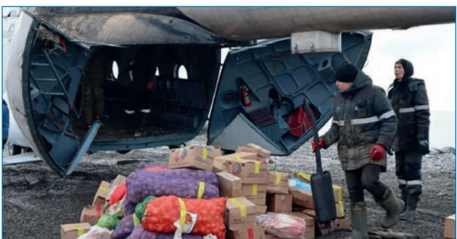
Доставка продуктов на станцию

мечались случаи поломок, связанные преимущественно с активностью белых медведей.