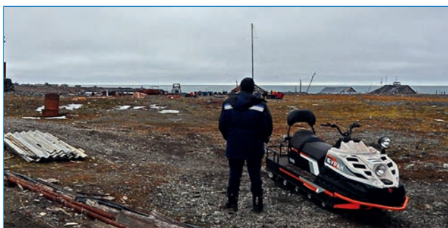
Снегоход «Буран» на станции ОГМС им. Е.К. Федорова (Мыс Челюскина)