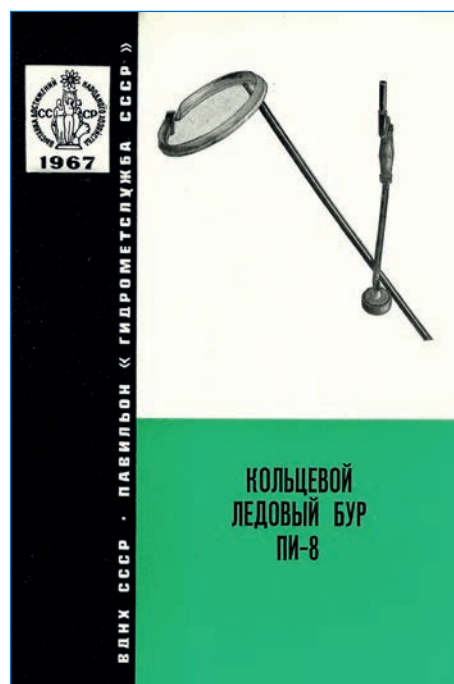
Информационный листок о буре ПИ-8 для Выставки достижений народного хозяйства. 1967 год. Фонды ААНИИ

Бур Черепанова прошел проверку временем, благодаря своей эффективности, простоте конструкции и легкости, его производство продолжается и в настоящее время. Он используется не только ледоисследователями (его применение резко сокращает время и усилия на отбор образцов льда), но и гидрологами при подготовке майн во льду для опускания приборов, при постановке судов на ледовые якоря, гляциологами для отбора кернов из ледников. Его нередко применяют и рыбаки для подготовки лунок во время зимней подледной рыбалки.