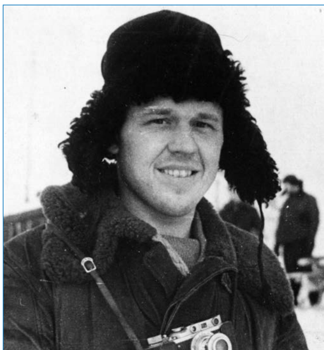
В экспедиции на Земле Франца-Иосифа. Весна 1948 года.