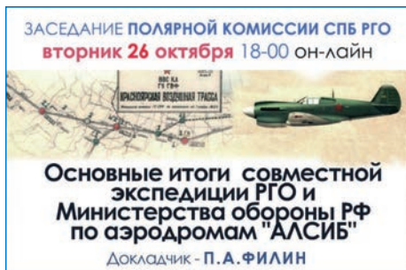
Приглашение на онлайн-заседание Полярной комиссии СПб РГО 26 октября 2021 года