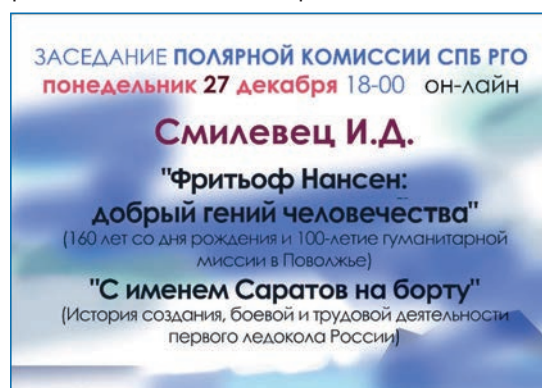
Приглашение на онлайн-заседание Полярной комиссии СПб РГО 27 декабря 2020 года

Особенное место среди полярных изданий занимают книги известного путешественника, историка и краеведа, большого друга нашей Полярной комиссии Игоря Демьяновича Смилевца. Две новые книги — «Маяк в океане» и «Саратовский след в Арктике» — были представлены на онлайн-заседании 29 января. Автор, житель поволжского города Энгельса, на протяжении многих лет занимается изучением истории своего края и ее связи с историей полярных исследований. Ему удивительным образом удалось в относительно короткий период подготовить, основываясь на архивных документах, и издать прекрасно иллюстрированные книги, содержащие интересные малоизвестные факты.