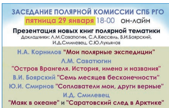
Приглашение на онлайн-заседание Полярной комиссии СПб РГО 29 января 2021 года