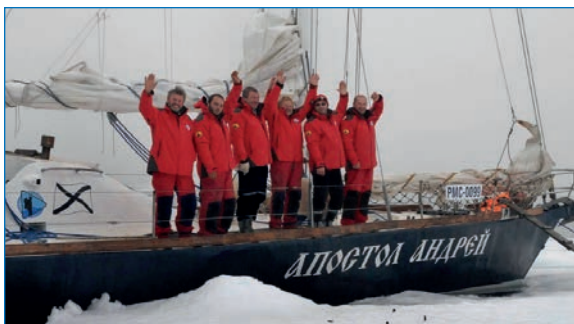
Яхта «Апостол Андрей».