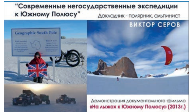
Приглашение на онлайн-заседание Полярной комиссии СПб РГО 29 марта 2021 года

ственные экспедиции к Южному полюсу» был показан авторский фильм «На лыжах к Южному полюсу».