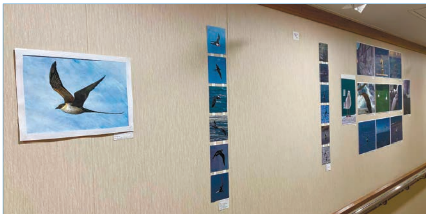
Выставка «Птицы» на ЛСП.

Совсем недавно полярники открыли в коридорах на третьей палубе ЛСП выставку «Птицы». Здесь представлены рисунки, фотографии и оригами, посвященные пернатым.