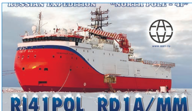
Карточка с позывными радиостанции экспедиции СП-41

Ледостойкая самодвижущаяся платформа (ЛСП) «Северный полюс» претендует на звание первого в истории креативного пространства в высоких широтах Северного Ледовитого океана. Досуг участников экспедиции «Северный полюс-41» Арктического и антарктического научно-исследовательского института включает как традиционные занятия, такие как чтение, просмотр кинофильмов, радио и настольные игры, так и другие мероприятия. К услугам читателей-исследователей на судне обширная библиотека, включающая произведения классиков мировой литературы и современных авторов, а также научные издания, посвященные изучению полярных регионов. Два-три раза в неделю организуется коллективный просмотр документальных и художественных фильмов с последующим обсуждением и обменом мнениями.