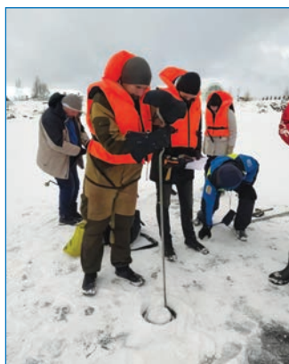
Примеры практических работ на полевой станции «Ладога»

Р.Е. Власенков, Ю.А. Шибавев (ААНИИ).