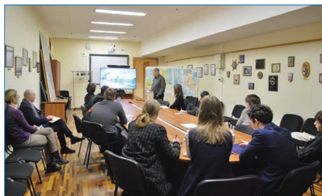
Теоретические занятия, проведенные сотрудниками отдела геофизики (слева) и географии полярных стран (справа)

дования и экспедиционные работы в Арктике и Антарктике, исследования изменения климата Земли... Обо всем этом ребятам рассказывали опытные сотрудники каждого из отделов ААНИИ.