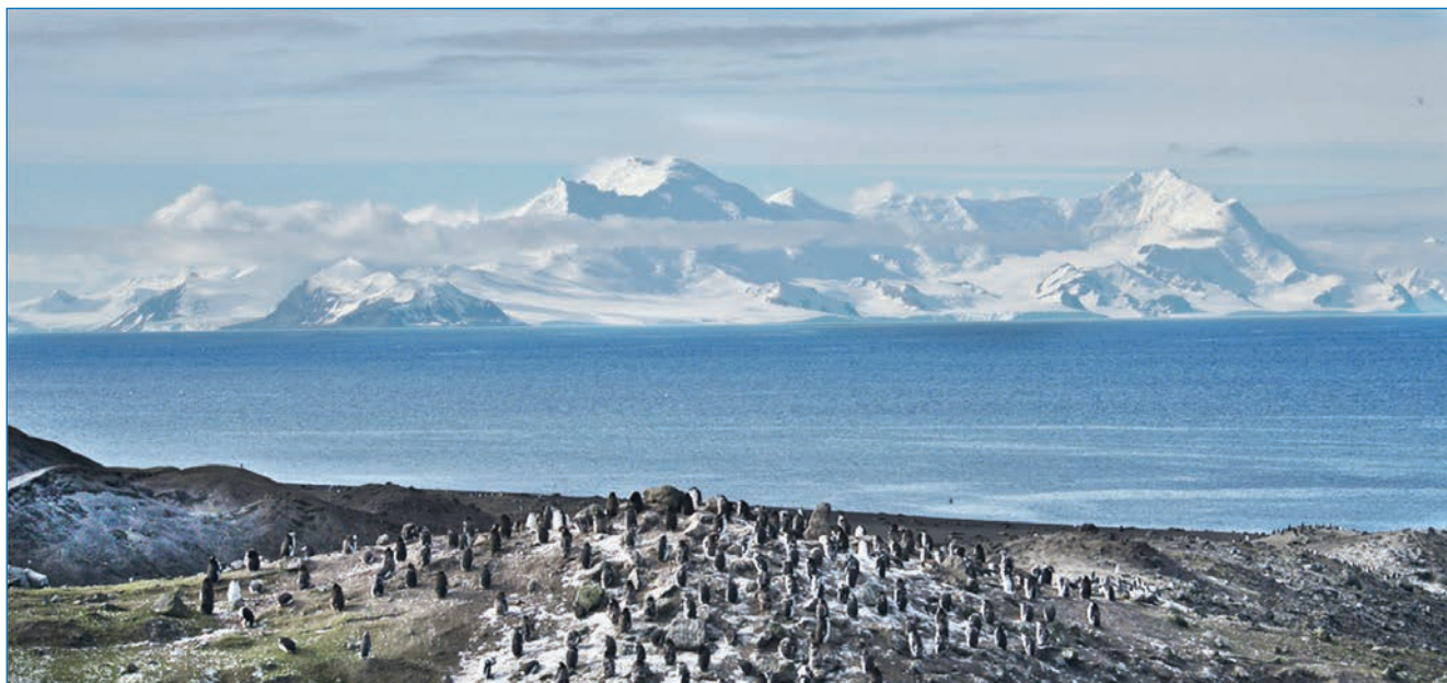
Вид с о. Десепшен на о. Ливингстон (Смоленск)