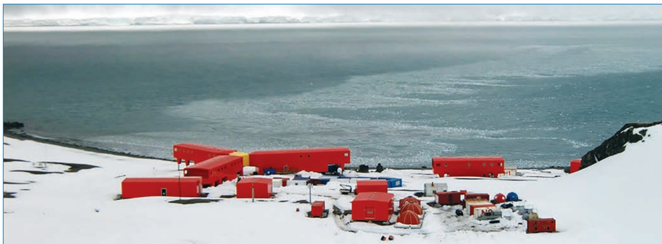
Испанская антарктическая база «Хуан Карлос I» на о. Ливингстон (Смоленск)

в промерзшей пустоши от холода и голода, так и не увидев парусов на горизонте?