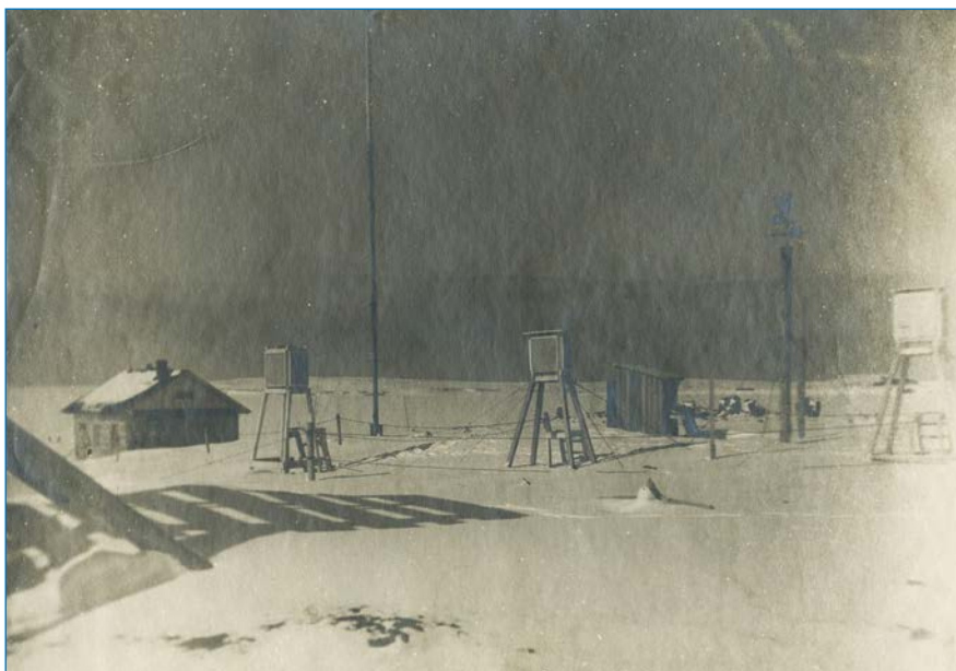
Метеорологическая площадка и строения станции. 1946 год.

Невозможность заряжать аккумуляторы отразилась и на научной работе отрицательно».