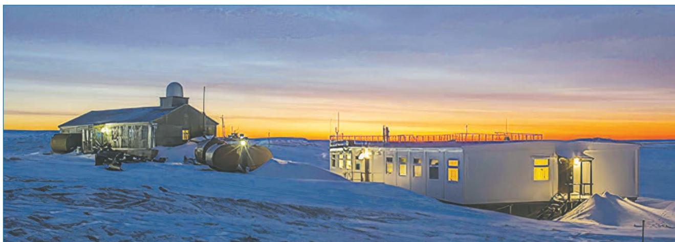
Аэрологическая станция Малые Кармакулы. 2022 год.

К.А. Козлов (АЭ Малые Кармакулы ФГБУ «Северное УГМС»)