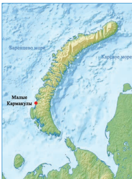
Расположение полярной станции Малые Кармакулы