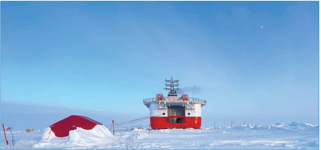
Выносной ледоисследовательский пункт вблизи от ЛСП. 30 марта 2023 года

– в апреле выполнена станция исследования физических свойств льда у борта судна и трехмерное моделирование корпуса судна;